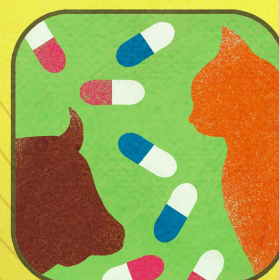
Farmaci per Animali