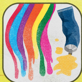
Vernici Inchiostri Adesivi