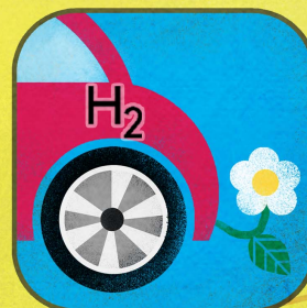
Auto a Idrogeno