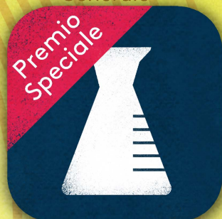
Chimica di base