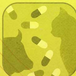
Farmaci per Animali