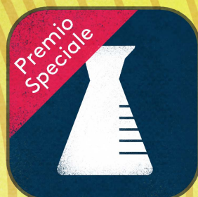
Chimica di base *