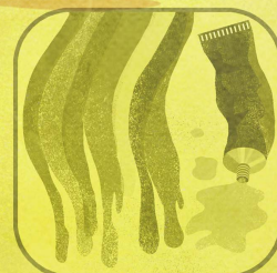
Vernici Inchiostri Adesivi